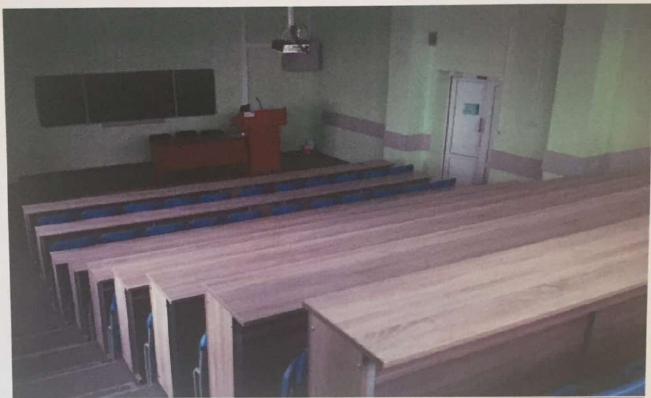
Фото аудитории 6-429