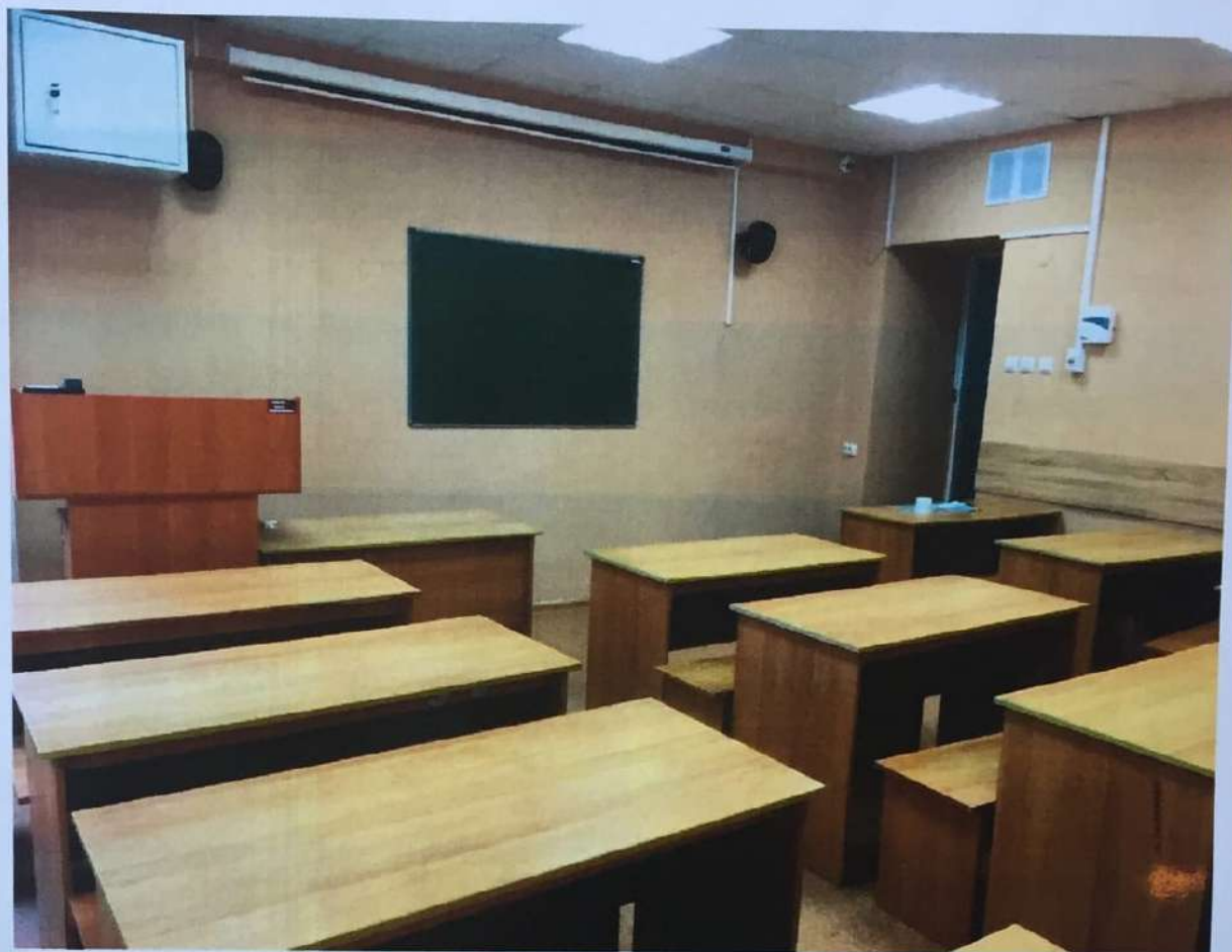
Фото аудитории 8-215