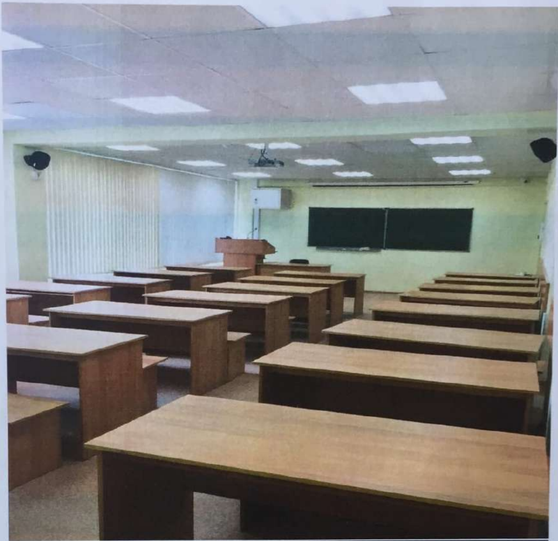
Фото аудитории 8-218