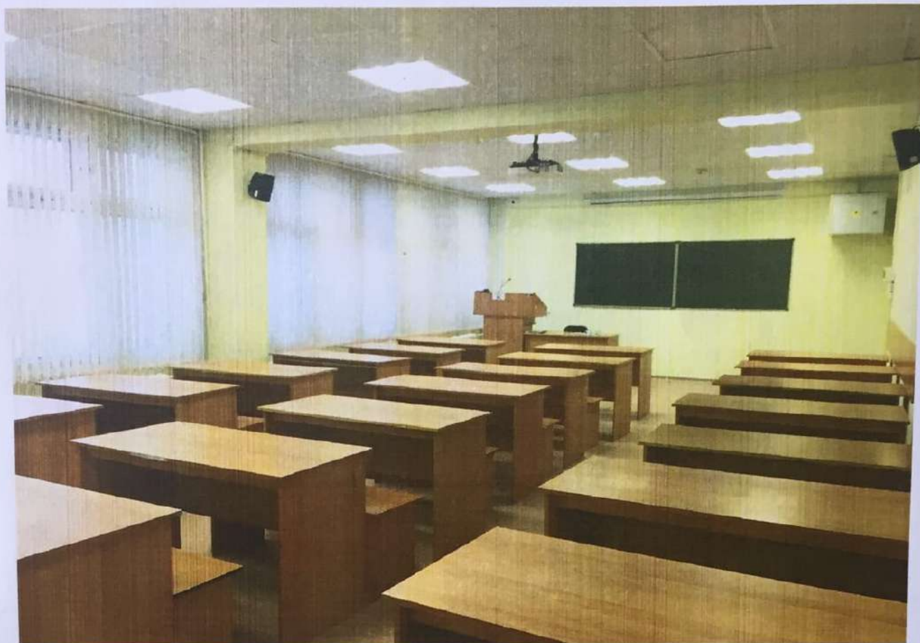
Фото аудитории 8-206