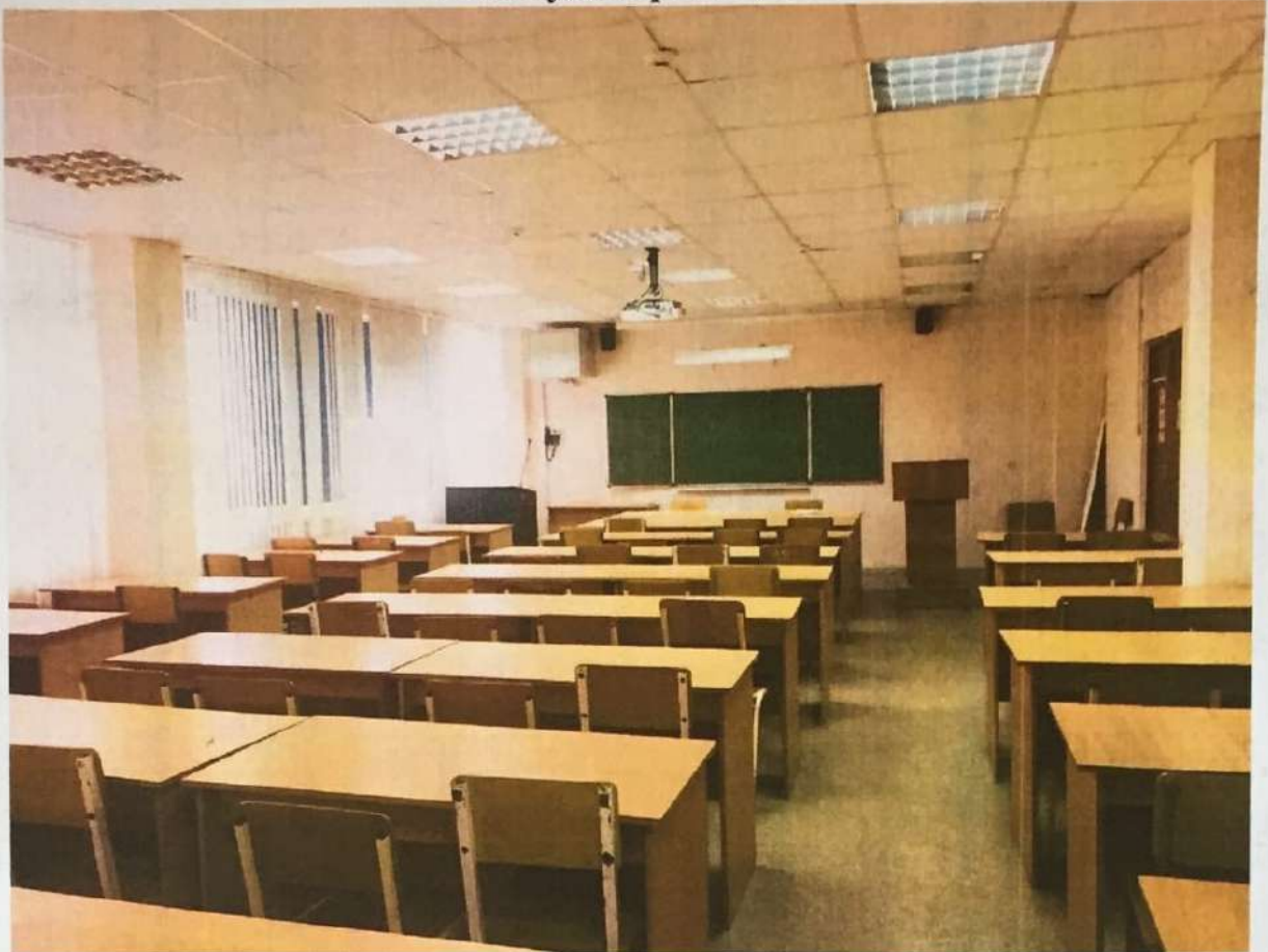
Фото аудитории 14-114