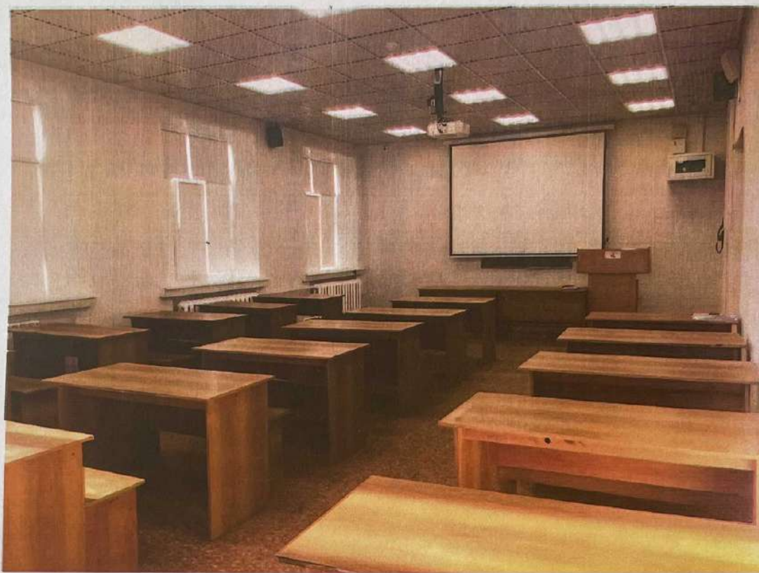
Фото аудитории 6-412