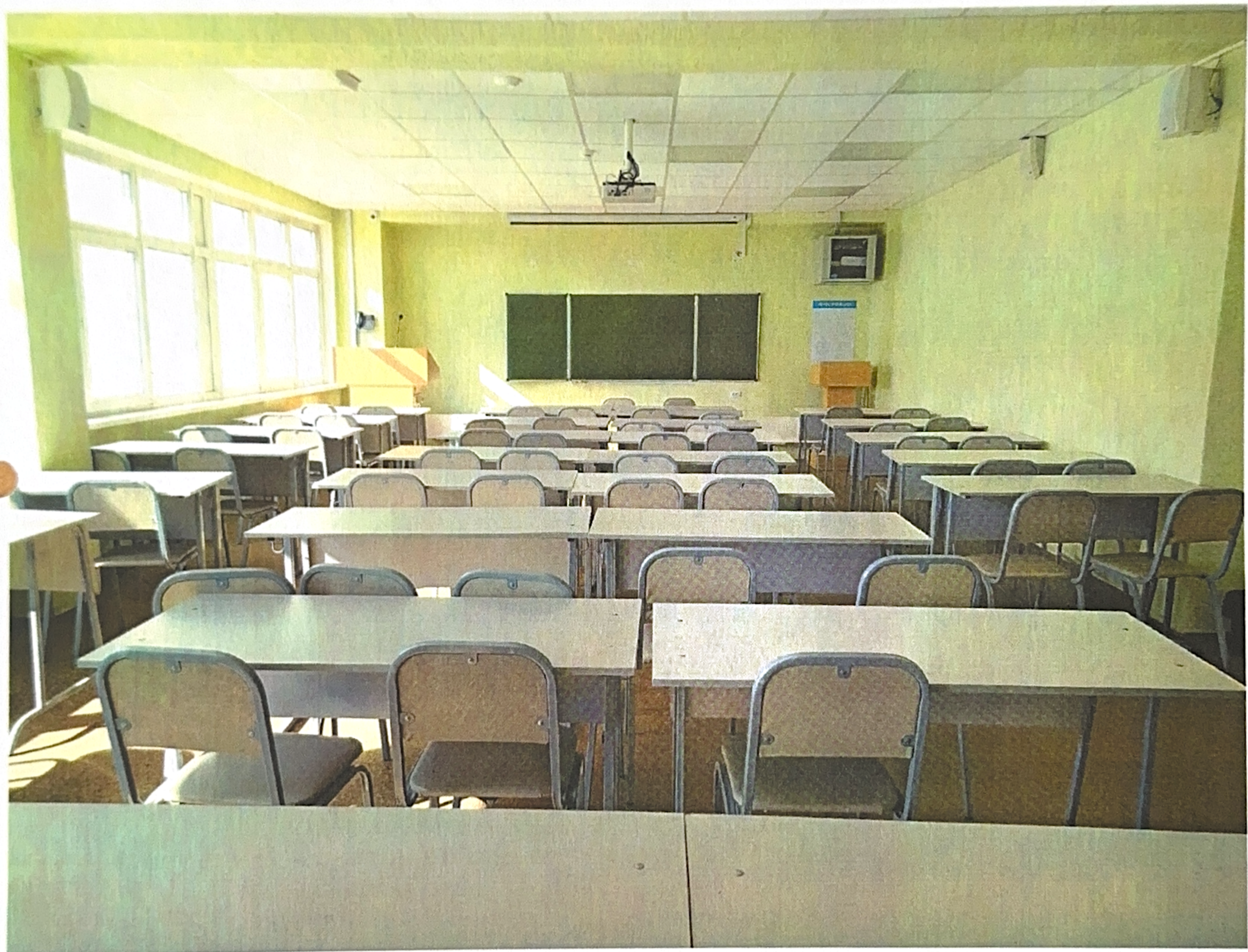
Фото аудитории 14-518