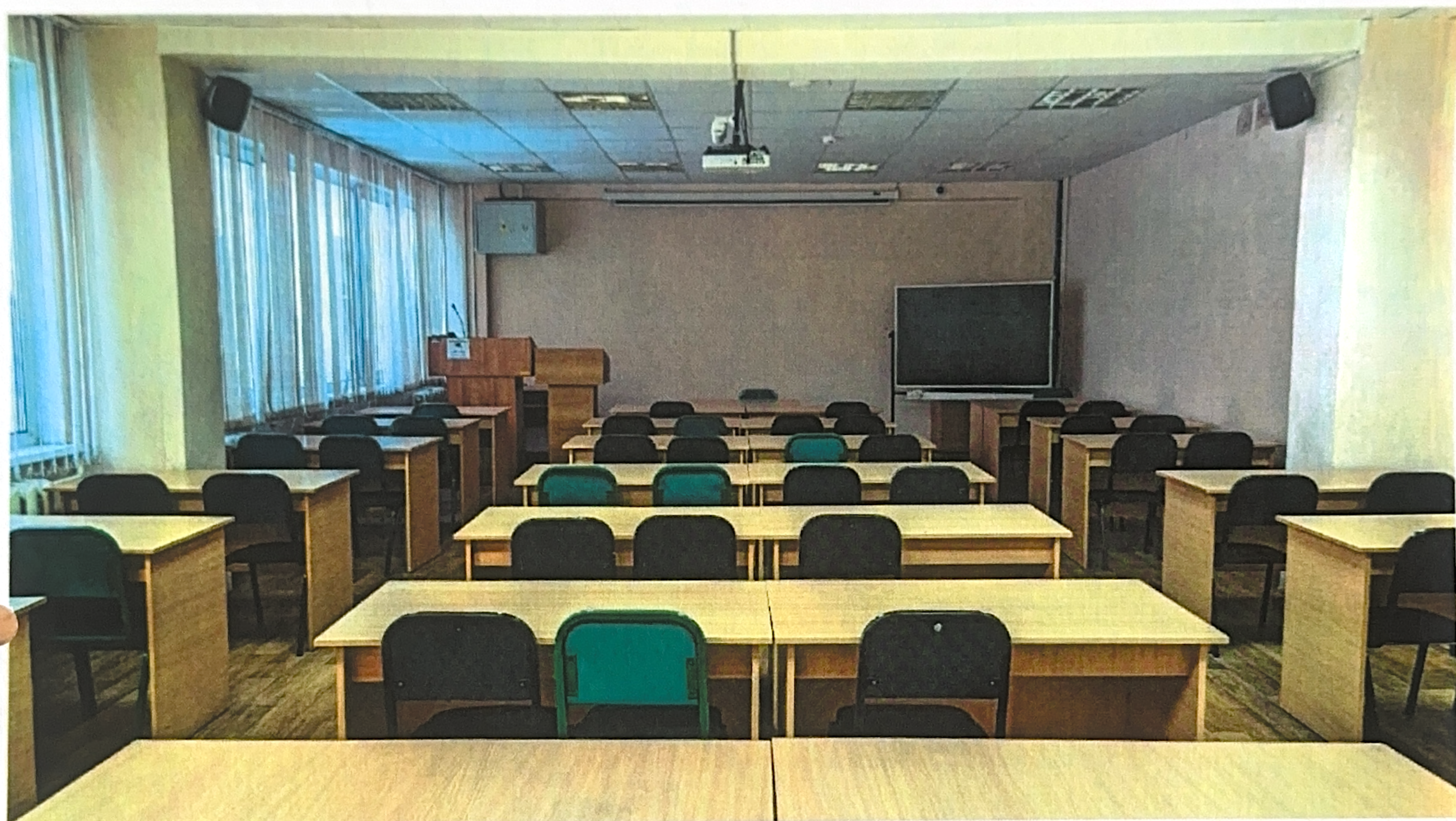
Фото аудитории 14-209