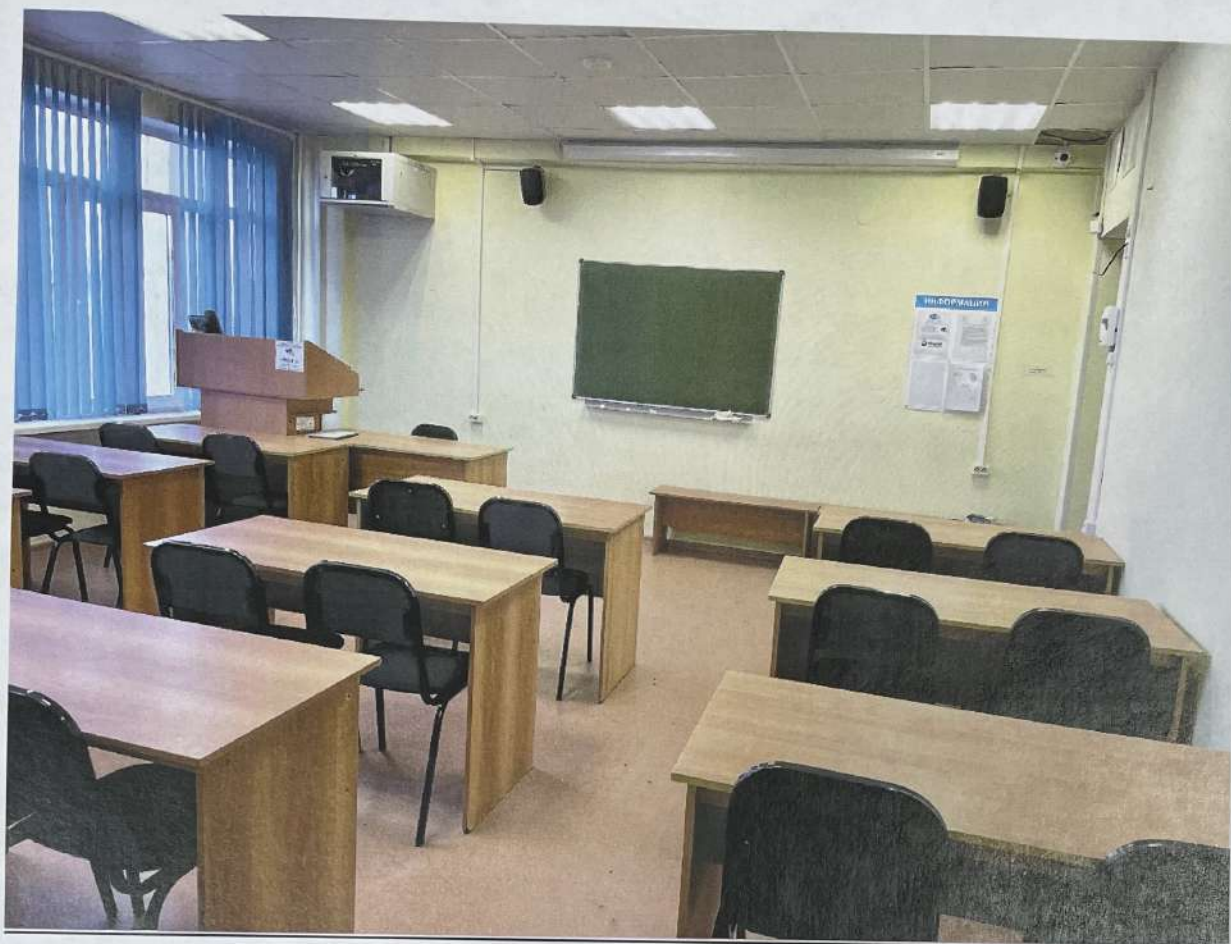
Фото аудитории 8-313